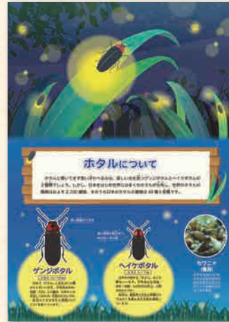
ホタルの説明用パネルを作成しました。