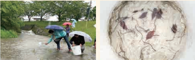
ウナギの稚魚の放流