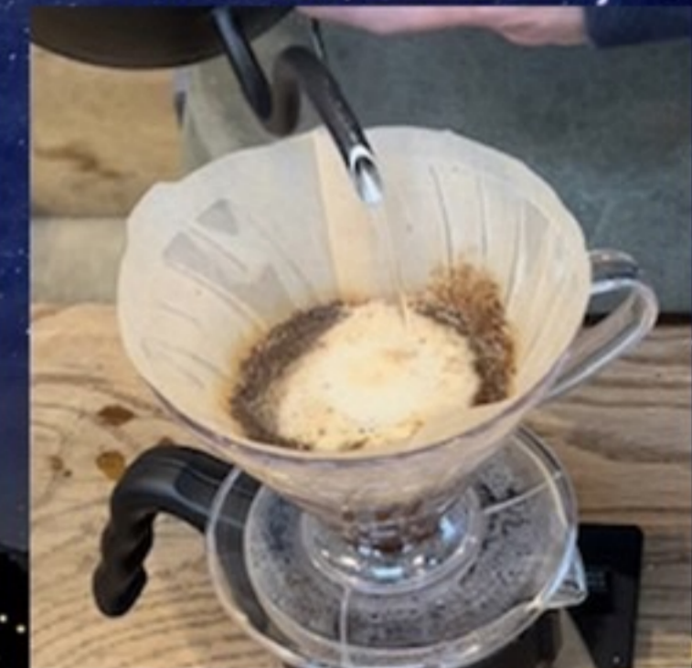
STEREO COFFEE (ドリップコーヒー)