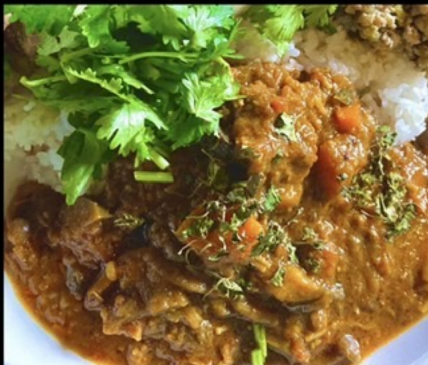
ケータリング・ケータロ (無添加スパイスカレー)