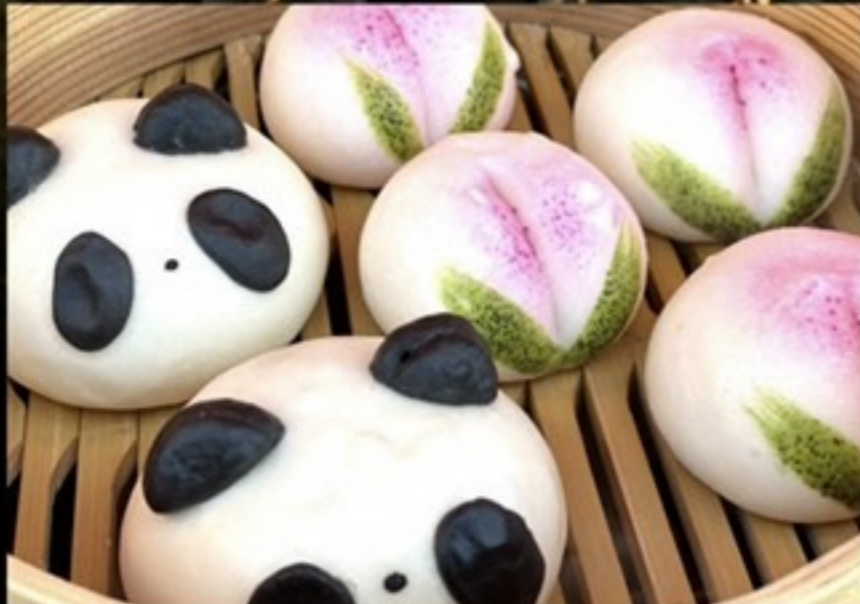
桃源郷2.0 (桃まん・パンダまん)