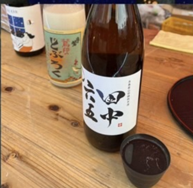
桃源郷2.0 (日本酒「熱燗・冷酒」)