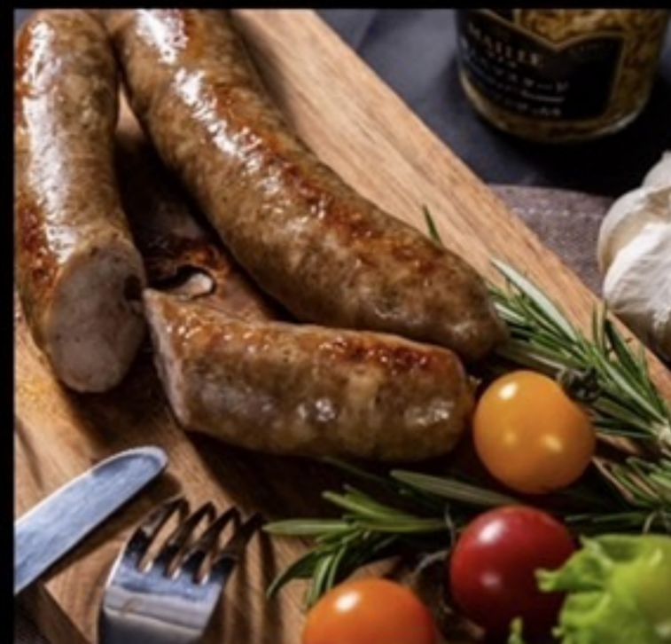
TOBIKATAYA (自家製ソーセージ)