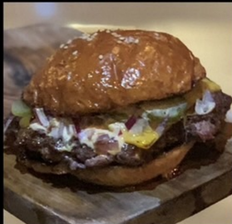
THE BASKET (チーズバーガー)